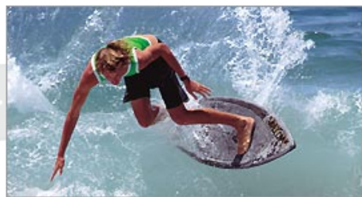
世界中のサーファーが集う。

サーフィンカルチャーのメッカ 波乗りが集まるビーチ 毎年サーフィンの国際大会が行われる「USAサーフシ ティ」と呼ばれる街。8.5マイルにも及ぶ白浜の静かな ビーチは、訪れる価値大。