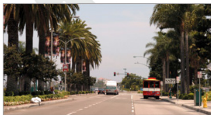
カリフォルニアの風を感じてみよう。

アナハイムから少し遠出をして海岸線ドライブ！ お気に入りの音楽とスナックで素敵な風景を楽しんで みては？