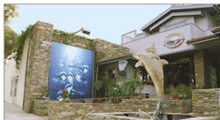
街中にもオブジェや壁画が多く見られます。

街全体にアートが溢れるハイセンス・ビーチリゾ ート アーティストが多く住み、100以上のギャラリーやア トリエが並ぶ。パブリックアートなども楽しめる個性的な 街です。