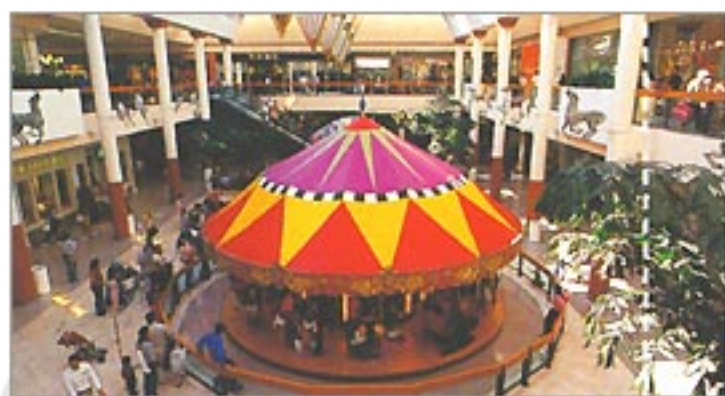
巨大ショッピングモール。

アナハイムへの帰り道はショッピングモールに寄 り道 夜8時まで営業しているアナハイムのショッピングモ ール。1日の終わりに立ち寄って、プチショッピングが いかが？