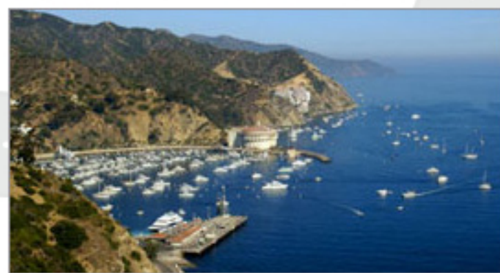
地中海を思わせる島の全景。

自然豊かな地中海の雰囲気漂うリゾートアイラ ンド アナハイムの南西の海に浮かぶカタリナ・アイランド。 島の88%が自然保護区で車輛規制のためレンタカー は利用できないが、アメリカの自然を肌で感じられる、 西海岸でも貴重なアイランドです。アパロンの街並み 散策やゴルフなどを楽しんでみては。